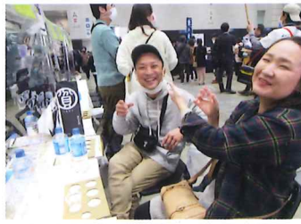
▲ 山形市から来たカップル