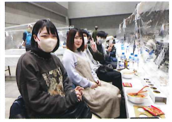
▲ 大学生のグループ

あんしん取材班が行く 朱鷺メッセ 2023 80の蔵元400種に12,000人 を訪ねて