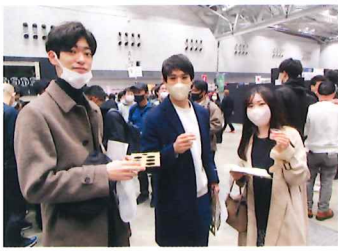
▲ 日本酒を語る若者