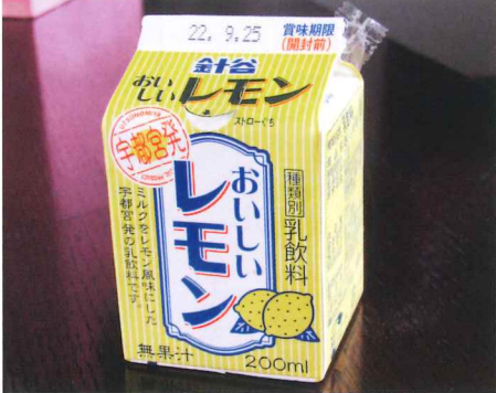
針谷おいしいレモン、レモン牛乳社長(長)取締役碧さん(左)工場内部

「ミルクの国とちぎ」 栃木県は本州1位の牛 乳産量を誇る。(北海 道は全国5%の生産量) その栃木県に「レモン 牛乳」が存在し、永年 に亘って愛飲されてい る。この情報から、レ モン牛乳を求めて栃木 県宇都宮市の針谷乳業 株式会社を訪ねた。