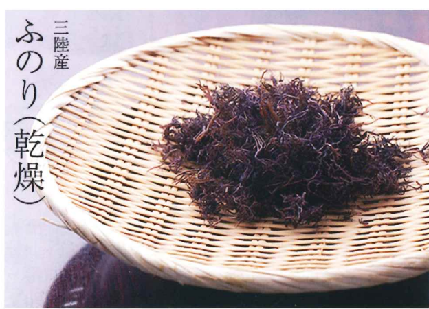
三陸産 ふのり (乾燥)

胆石予防・便秘解消効果・ダイエット効果・生活習慣病予防・疲労回復効果・高血圧や動脈硬化の予防・皮膚や粘膜の健康維持効果・貧血予防・骨粗しょう症予防・むくみ予防など多数の効能が挙げられる。正に日本古来の健康食品なのである。